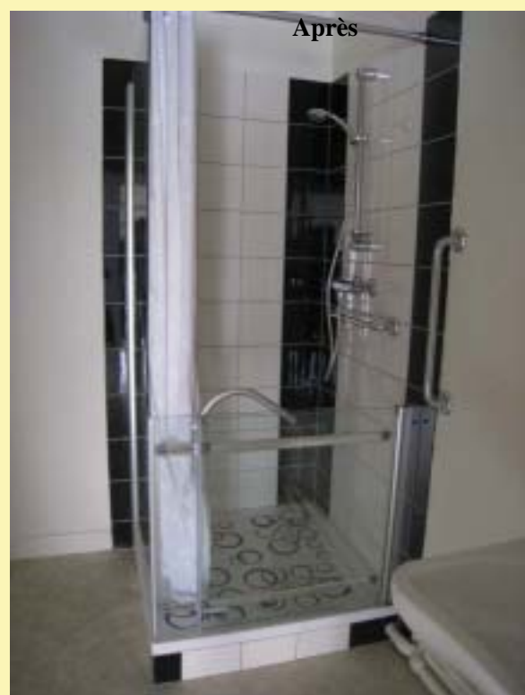
Exemple de réalisation