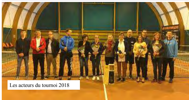
Les acteurs du tournoi 2018