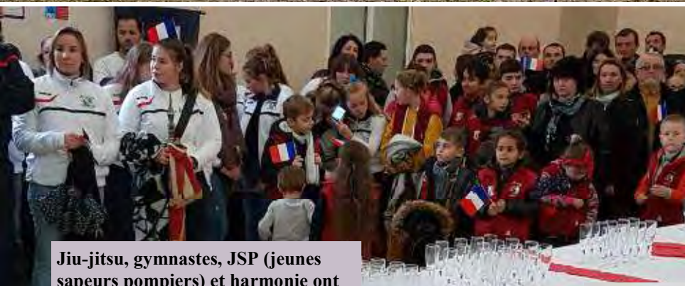
Jiu-jitsu, gymnastes, JSP (jeunes sapeurs pompiers) et harmonie ont participé à la cérémonie.