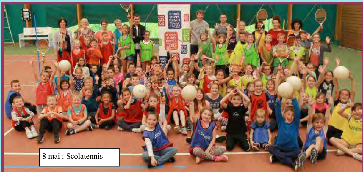
8 mai : Scolatennis