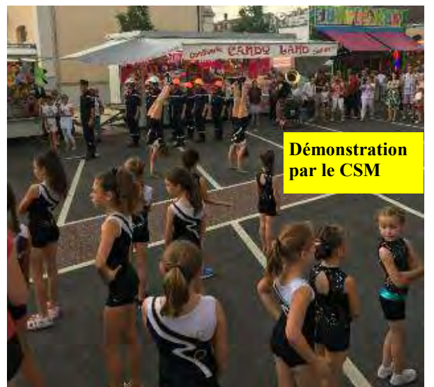
Démonstration par le CSM