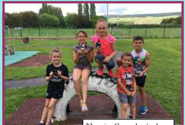
23 mai : Cross des écoles

Remise d'une calculette aux élèves de CM2 pour leur entrée en 6ème.