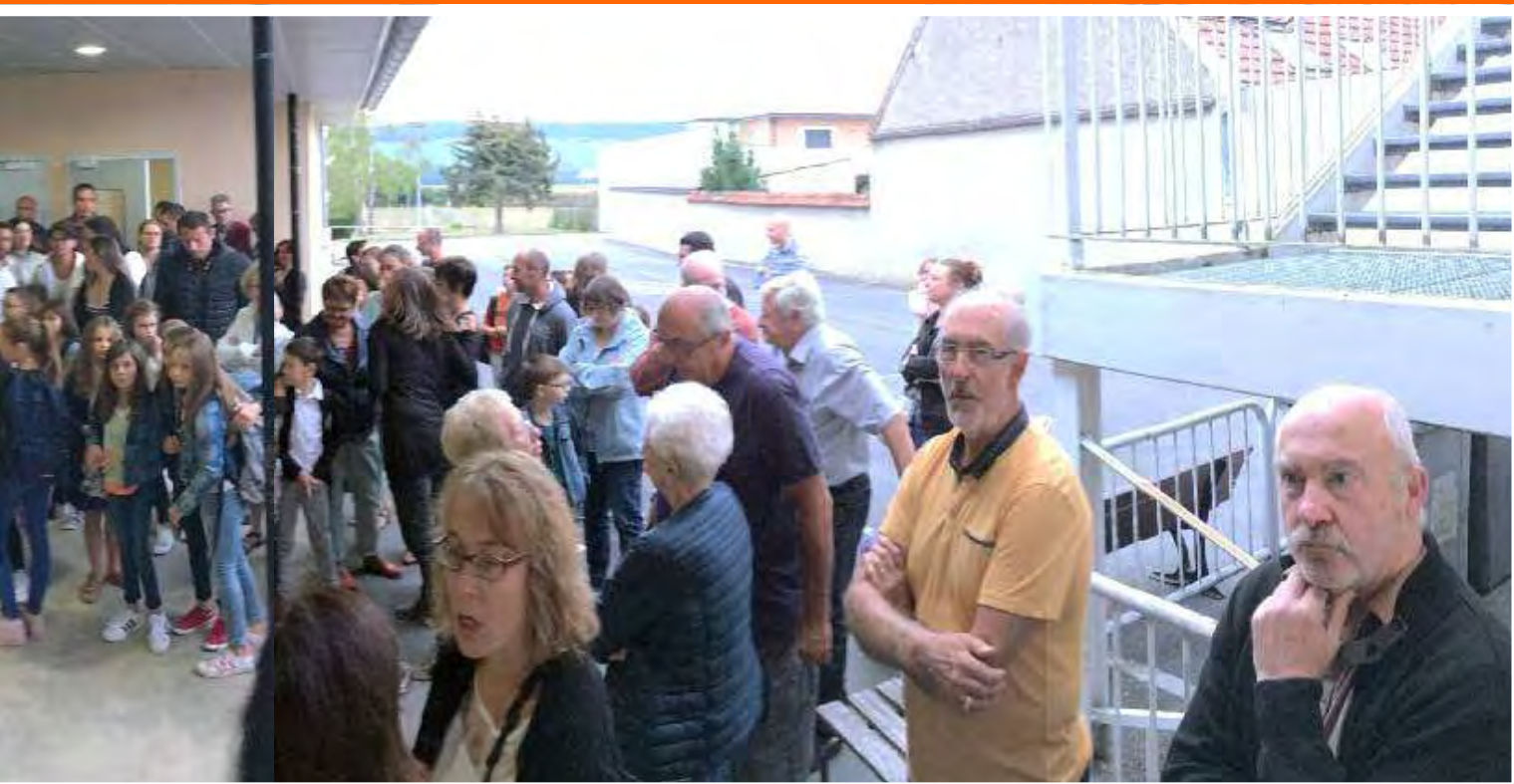
consignes de rentrée de Mme Coutel.