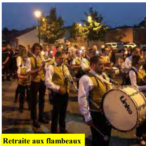
Retraite aux flambeaux