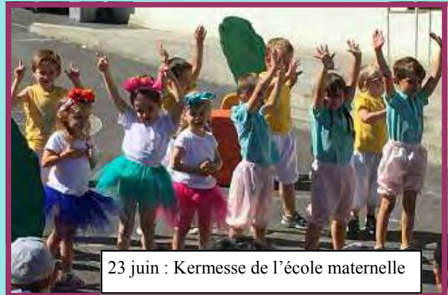
23 juin : Kermesse de l'école maternelle

Remise d'une trousse garnie aux enfants de la grande section maternelle pour leur entrée au CP Trousse et calculettes offertes par l'amicale des écoles et la municipalité.