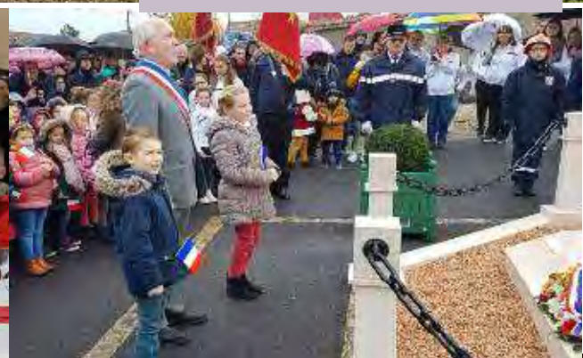
Les enfants ont chanté, au cimetière et à la salle des fêtes, la Marseillaise apprise à l'école.