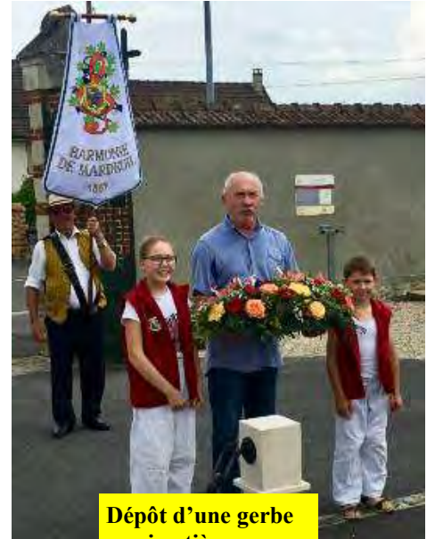
Dépôt d'une gerbe au cimetière