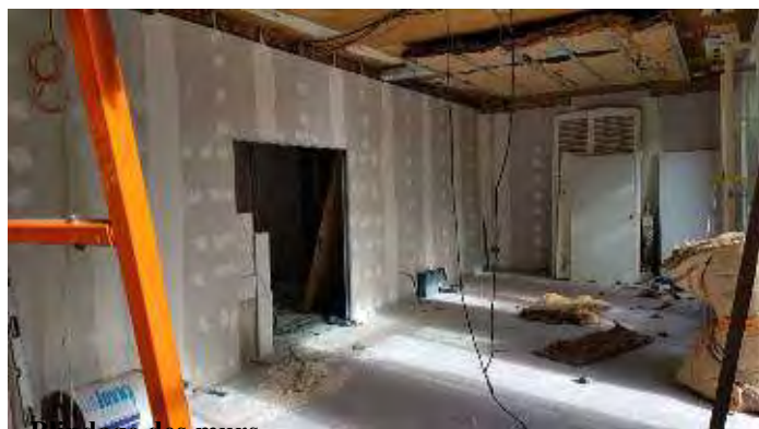
Bandage des murs

Le réseau informatique est totalement câblé et la connexion internet se fait par la fibre.