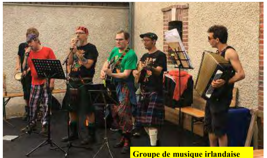
Groupe de musique irlandaise