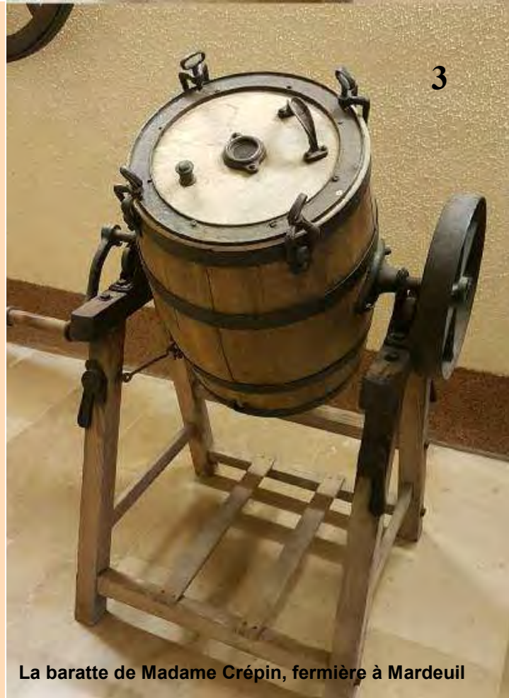
La baratte de Madame Crépin, fermière à Mardeuil

Le papier à beurre fabriqué de façon traditionnelle est réalisé à partir de papier sulfurisé (5). Texte et illustration sont imprimés à l'encre alimentaire de couleur bleue, verte ou rouge selon que le beurre est cru, demi-sel ou salé.