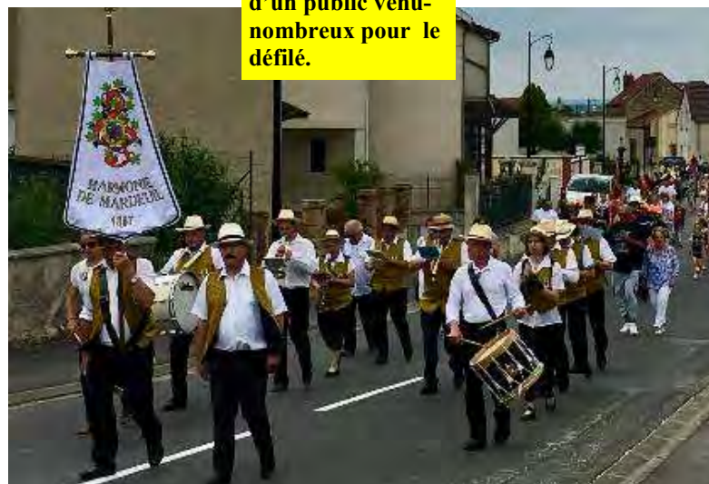
L'Harmonie suivie d'un public venu-nombreux pour le défilé.