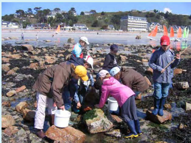
Recherche de coquillages