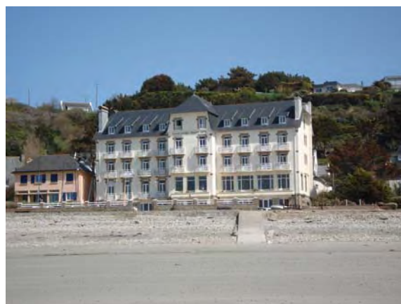
La classe de mer