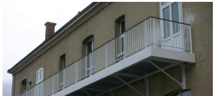
Passerelle et escalier de secours repeints