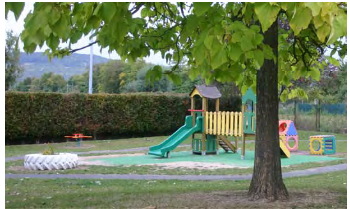
Une nouvelle aire de jeu avec sol adapté à l'école maternelle

L'amicale des écoles apportera sa quote-part ainsi que le Département.