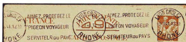
Allusion aux pigeons voyageurs, porteurs de pigeons-grammes, utilisés pendant la guerre 1914-1918.