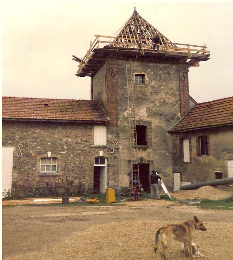
Constituée de sapins des Vosges non équarris, la charpente fut rénovée en 1985, ainsi que la toiture.

Les seigneurs et gentilshommes, seuls, possédaient des colombiers, privilège attribué par le roi.