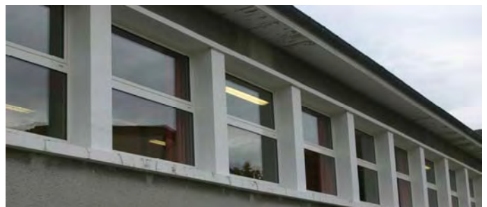
Les nouvelles fenêtres de l'école maternelle