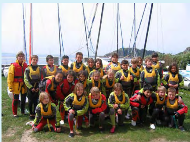
Bien équipés, prêts à naviguer

visite des sept îles en bateau, body board, sentier des douaniers, découverte du milieu marin et visite de la Ligue Protectrice des Oiseaux