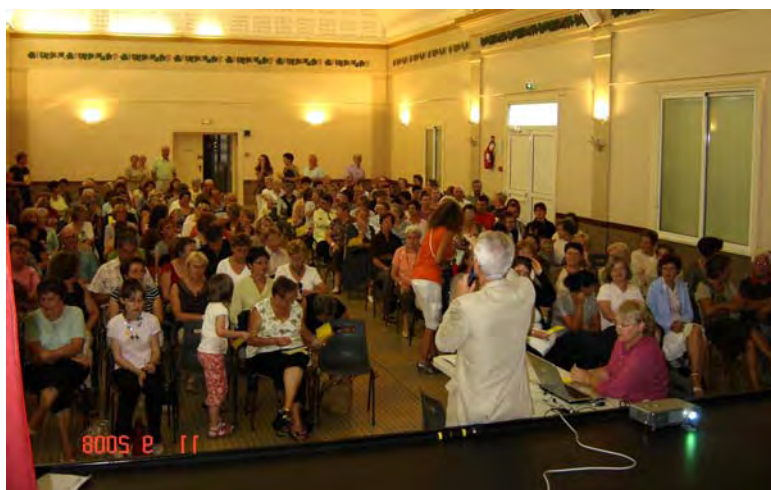
Plus de 200 personnes pour la réunion de rentrée

Les activités du club culturel ont repris cette année et remportent encore un énorme succès aussi bien auprès des Mardouillats que des gens de l'extérieur. Certains ateliers sont au complet et se voient contraints de refuser des inscriptions.