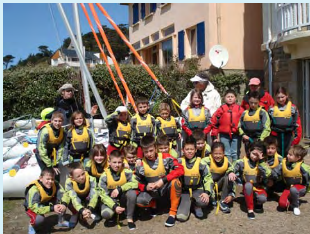
Au top pour la voile