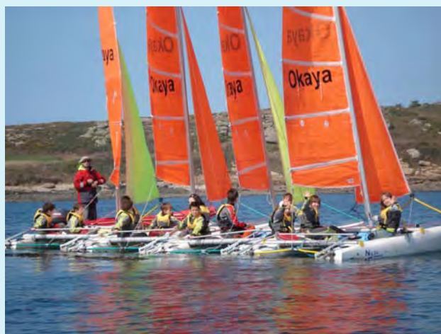
Nos beaux catamarans